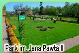
Park im. Jana Pawła II

Kartuskie Centrum Kultury jest jednym z organizatorów spotkania Kaszubów. To miejsce spotkań działaczy kulturalnych i siedziba Kina Kartuzy.