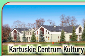
Kartuskie Centrum Kultury

XIV -wieczna Kartuska Kolegiata jest jednym z najcenniejszych zabytków Pomorza. To tutaj odbędzie się o godz. 12:00 uroczysta msza św.