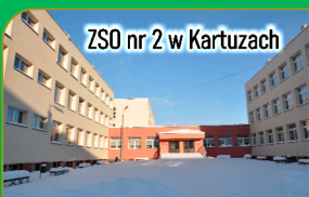
ZSO nr 2 w Kartuzach

Aleja im. Kard. Wyszyńskiego to jedno z nowych, niezwykle urokliwych miejsc, które powstało w ramach projektu Rewitalizacji Kartuz.