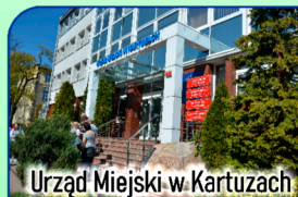
Urząd Miejski w Kartuzach

Zrewitalizowany Rynek w Kartuzach zapewnia odpoczynek w malowniczym otoczeniu i bogatą ofertę gastronomiczną.