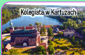
Kolegiata w Kartuzach

Przy kartuskim Urzędzie odsonięta zostanie tablica upamiętniająca XXIV Światowy Zjazd Kaszubów w Kartuzach.