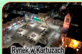
Rynek w Kartuzach

Odrostaurowany dworzec integracyjny w Kartuzach to także siedziba MiP Biblioteki Publicznej w Kartuzach.