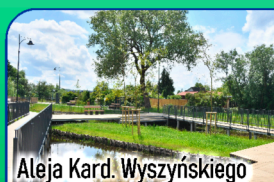
Aleja Kard. Wyszyńskiego

Wyspa Łąbedzią to dzisiaj miejsce spacerów i rekreacji dla całych rodzin. Tutaj zlokalizowane są taweczki, plac zabaw dla dzieci i wypożyczalnia sprzętu wodnego.