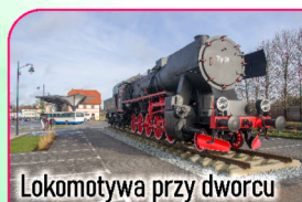
Lokomotywa przy dworcu

Muzeum Kaszubskie im. Franciszka Tredera w Kartuzach. Tutaj powitamy gości przybyszających pociągiem Transcassubia z Helu.